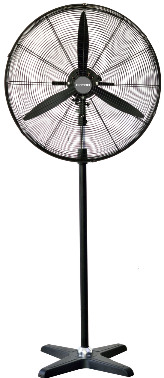
Mod. BDFP 650-750-T