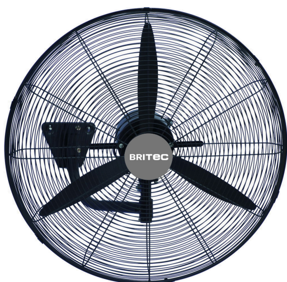
Mod. BDFP 500 / 600-TW