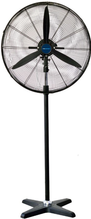
Mod. BDFP 500/600-TWB