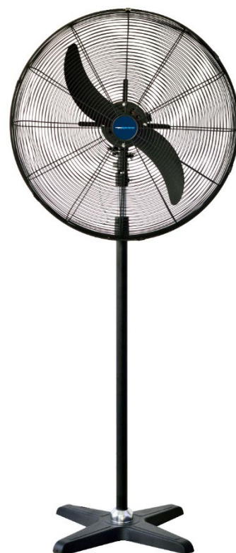
Mod. BDFP 650-750-TWB