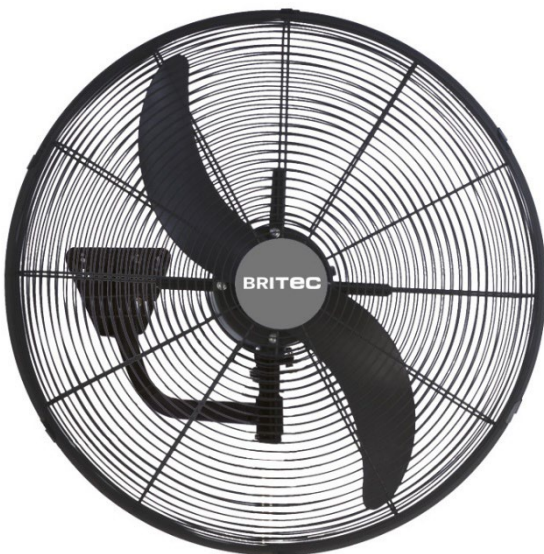
Mod. BDFP 650 / 750-TWB

Estos ventiladores han sido diseñados para entornos industriales: almacenes, fábricas, centros de trabajo, para ventilar espacios amplios y proteger el sobrecalentamiento de los equipos. Los ventiladores murales son idénticos a los ventiladores de pedestal. Sólo cambia el tipo de soporte.