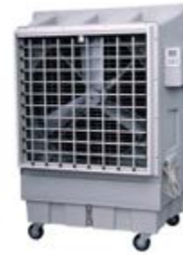
BKT - 18

Ref.: 381600KT12B Cód EAN: 8436596292154