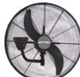
BDFP 650 / 750-TW