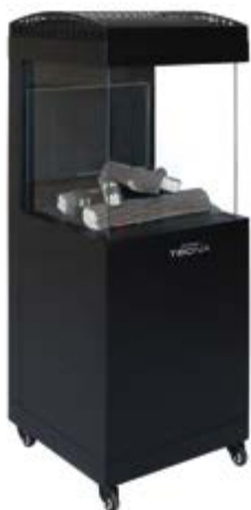
OSLO 3 CARAS VIDRO