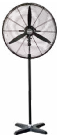
BDFP 500 / 600 - T