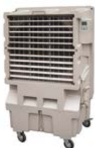
BKT - 12

Ref.: 381600KT09B Cód EAN: 8436596292147