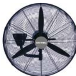
BDFP 500 / 600-TW