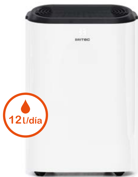
Ref.: 39BD12WIFI Cód EAN: 8436596290365