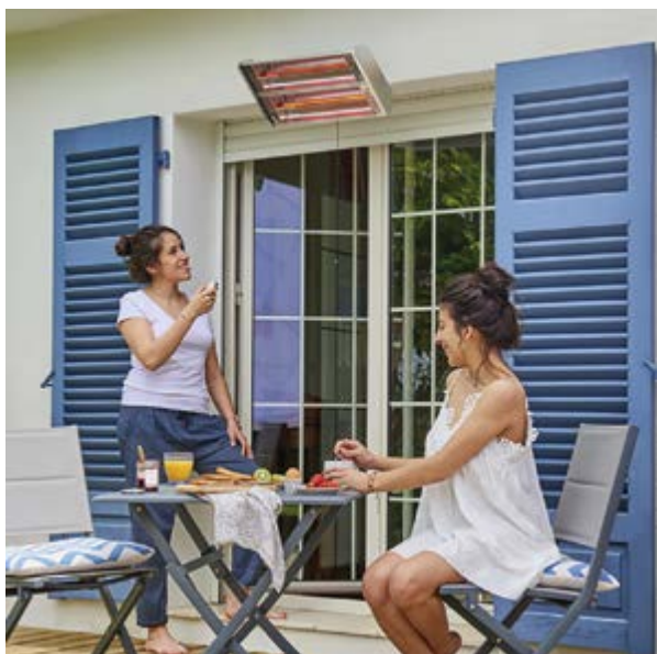
Braço suporte incluído