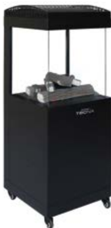
OSLO 4 CARAS VIDRO