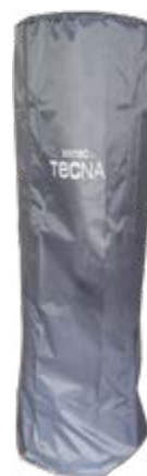
Capa protetora impermeável para estufa CORONA BAJA (COR CINZA)

Ref.: 5405FFCORB Cód EAN.: 8436596292772