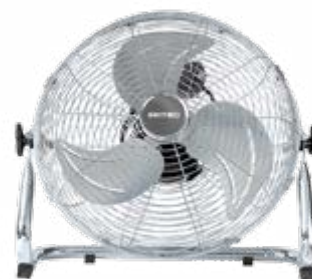
BFE4 40 / 45 / 50