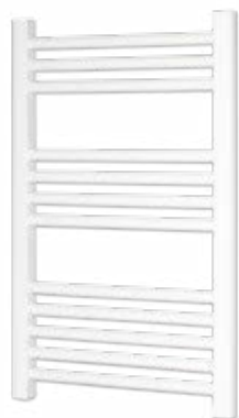
Branco RAL 9016

Ref.: 08GAB700500B Cód EAN: 8436596291607