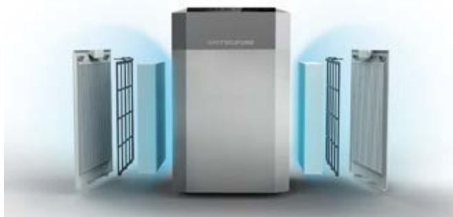
Ref.: 4200000LSVB Cód EAN: 8436596290334