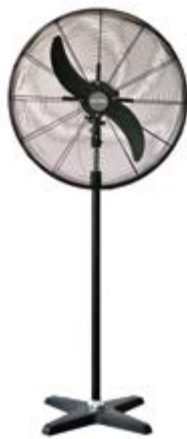
BDFP 650 / 750 - T