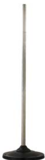
Suporte de pé BARI 3: Ref.: 54BASEBARI Cód EAN: 8436596292376