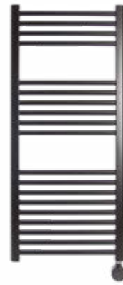
Preto RAL 9005

Ref.: 08ELO1120CR10B Cód EAN: 8436596291676