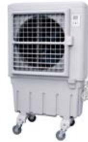
BKT - 6

Ref.: 381600KT05B Cód EAN: 8436596292123