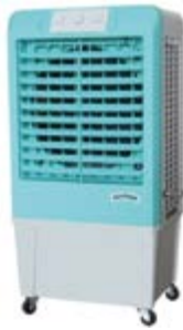
BKT - 4

Ref.: 381600KT04B Cód EAN: 8436596292116