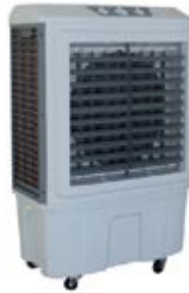
BKT - 5

Ref.: 381600KT04B Cód EAN: 8436596292116