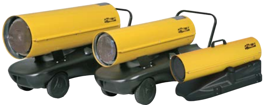
SD 70 / 130 / 170