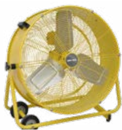
BHVF 60 L