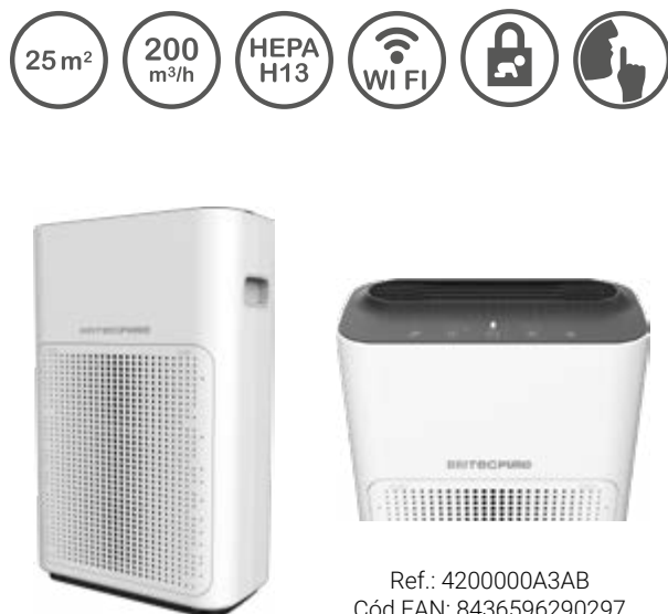
Ref.: 4200000A3AB Cód EAN: 8436596290297