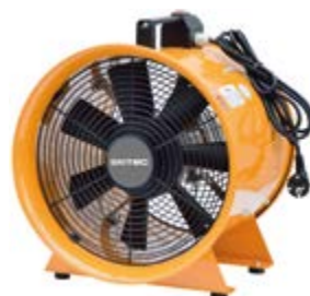
BPVT 20 / 25