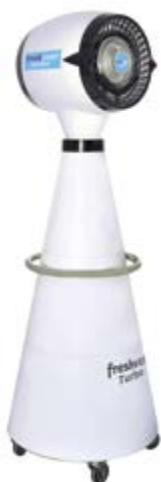
Ref.: 38170TURBOB Cód EAN: 8436596290587