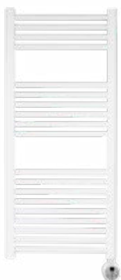
Branco RAL 9016

Ref.: 08ELO1150BL10CB Cód EAN: 8436596291652