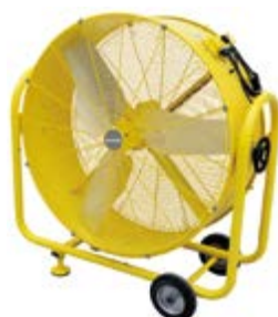
BHVF 90 L