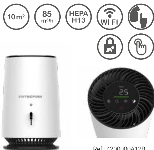
Ref.: 4200000A12B Cód EAN: 8436596290266