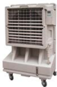
BKT - 9

Ref.: 381600KT09B Cód EAN: 8436596292147