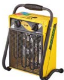
BHP-M-3 / 5 / 9 / 15