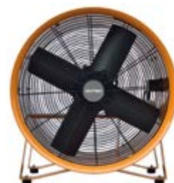
BPVT 30 / 35 / 40 / 45 / 50