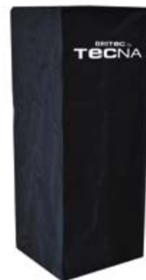
Capa protetora impermeável para estufa OSLO (COR PRETA)